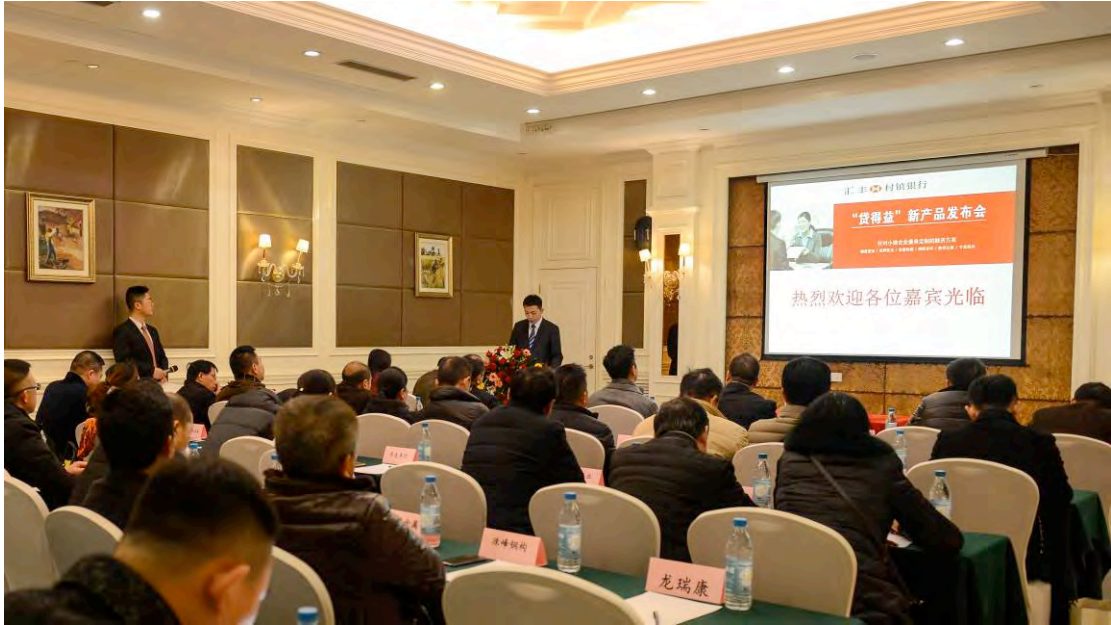
“贷得益” 产品发布会