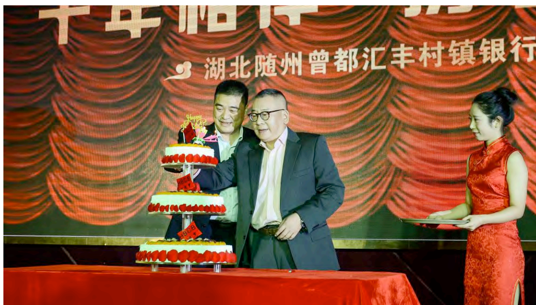
携手十年 步步登高